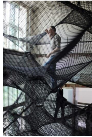
شكل (١١ ب)